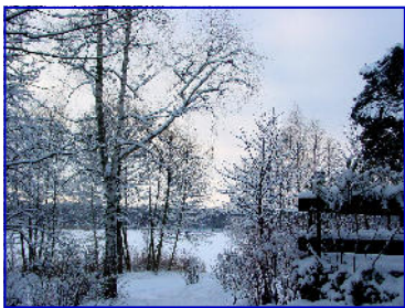
Winter- Wunder-Land Pinnower See

Freuen Sie sich auf traditionelle Weihnachtslieder LIVE gespielt auf Trompete, Keyboard, Akkordeon zu selbstgebackenen Torten und Kaffee. Die stimmungsvolle Tanzmusik spielt dann bis in den Abend, vielleicht darf es noch eine Stärkung sein? Eintritt p. P. 5,00 € bei Anmeldung